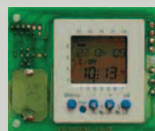
Steckplatz für optionales ELKA-Wochenschaltuhr-Modul